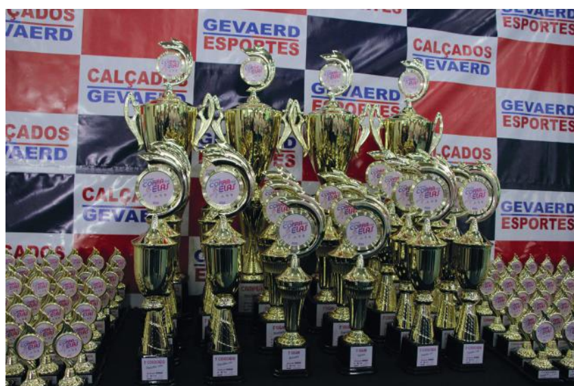
Todos os atletas ganharam medalhas e além dos cinco primeiros colocados geral dos 5km e 10km masculino e feminino, os cinco primeiros colocados por idade, masculino e feminino, também receberam troféus

*Os demais resultados das colocações podem ser conferidos no site: https://www.chiptiming.com.br/resultados/3corraporelas/brusque