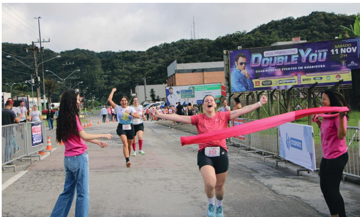
O evento, além do lado social, também promove a saúde e qualidade de vida, por meio do incentivo à prática esportiva. A superação de muitos atletas também esteve presente no evento