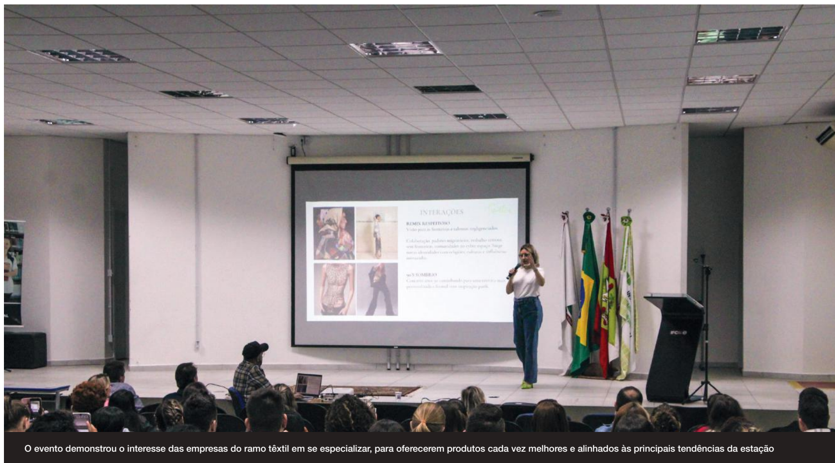
O evento demonstrou o interesse das empresas do ramo têxtil em se especializar, para oferecerem produtos cada vez melhores e alinhados às principais tendências da estação