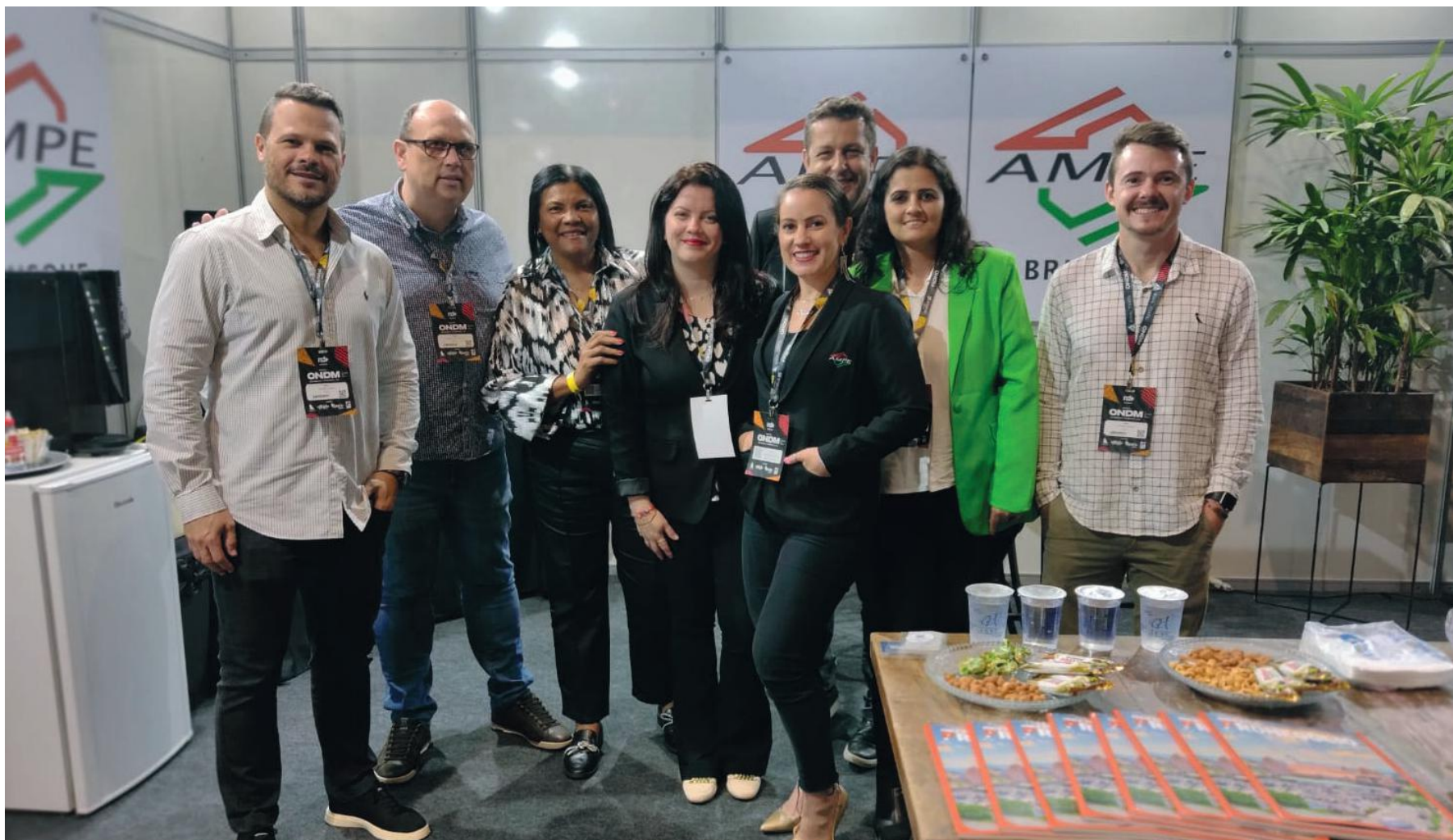
Diretores e colaboradores da AmpeBr, no espaço da entidade na feira do ONDM